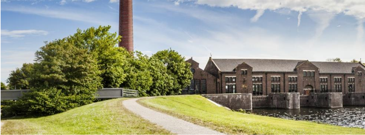
Beeld Ir. D.F. Woudagemaal

De rondleiding in het gebouw begint in de stookruimte. Een kist met steenkool herinnert aan de brandstof die vroeger werd gebruikt. De kolen werden met binnenvaartschepen aangevoerd uit Limburg. Tegenwoordig worden de vier stoomketels met elk 25 ton water verwarmd met zogenoemde duurzame diesel, geproduceerd uit plantaardige afvaloliën zoals gebruikt frituurvet.