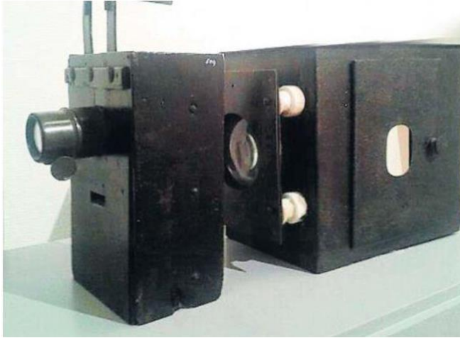
De kinematograaf waarmee Slieker werkte

in Nederland. In een advertentie in de Leeuwarder Courant kondigde Slieker zijn nieuwe attractie aan. "Het mooiste, schoonste, wat tot heden op het gebied van elektriciteit is uitgevonden."