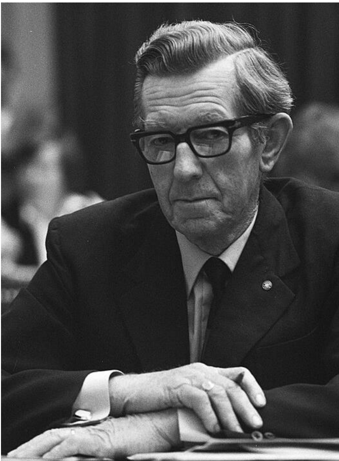
Hendrik Koekoek in de Tweede Kamer

Als boerenzoon heeft de geschiedenis van boerenpartijen me altijd geïnteresseerd. De komst van de BBB maakte het thema weer actueel. Reden om in mijn Zwolse studiekering Blauwvingers een presentatie te houden over de Boerenpartij en de Plattelandersbond.